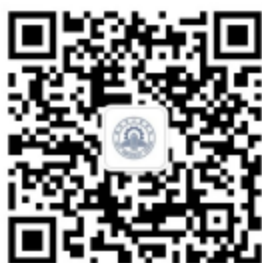
临沂市工业学校招生报名二维码

网上报名： 7月12日至13日扫描临沂市工业学校招生报名二维码，填报职教高考班志愿。